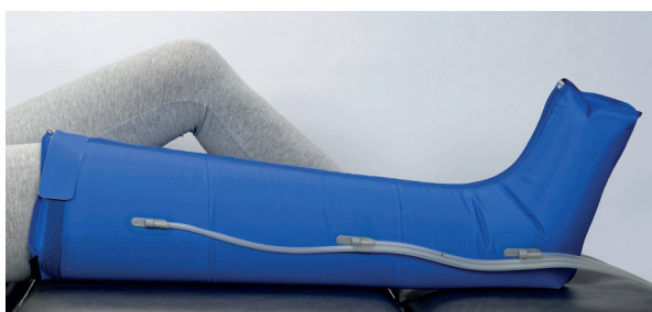
Beinmanschette mit 3 Luftkammern durchgehender Reißverschluss, Klettverschluss Größe M: Oberschenkelumfang bis 70 cm, Länge 85 cm Größe L: Oberschenkelumfang bis 83 cm, Länge 85 cm