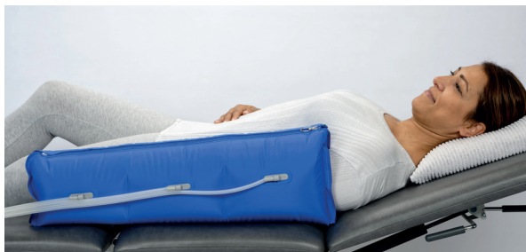
Armmanschette mit 3 Luftkammern durchgehender Reißverschluss Oberarmumfang bis 60 cm, Länge 67 cm

Der durchgehende Reißverschluss bei Arm- und Beinmanschetten erleichtert Anlegen und Reinigen. Ein zusätzlicher Klettverschluss ermöglicht eine optimale Anpassung im Bereich des Oberschenkels. Die Hüftmanschette ist individuell größenverstellbar.