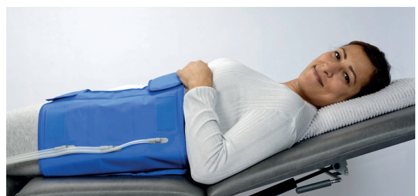
Hüftmanschette mit 6 Luftkammern variabler Klettverschluss auf Vorder- und Rückseite Hüftumfang einstellbar bis 150 cm, Länge 38 cm

In begründeten Fällen übernimmt die Krankenkasse die Kosten des Gerätes. Der behandelnde Arzt überwacht die Therapie.